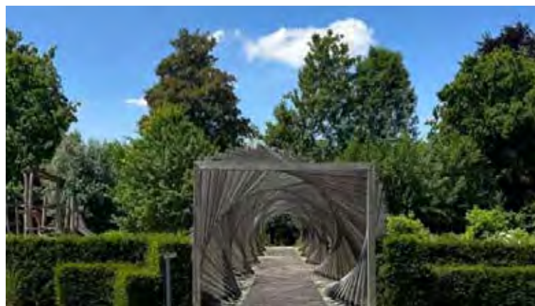
Les jardins Mallet-Stevens