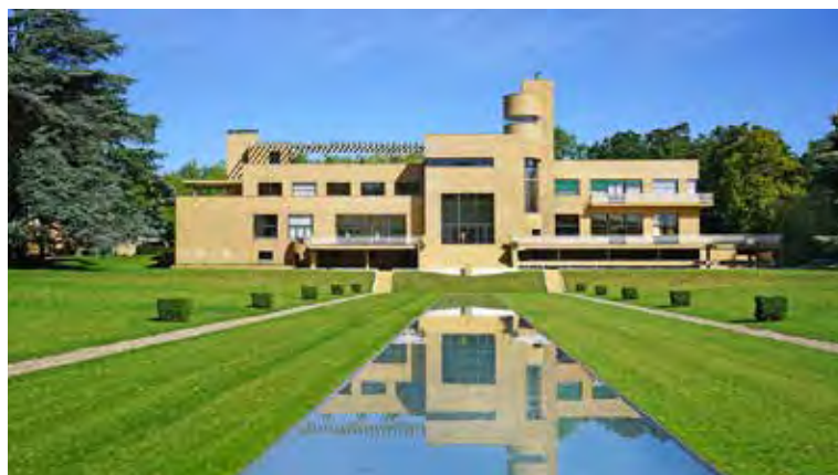
La Villa Cavrois